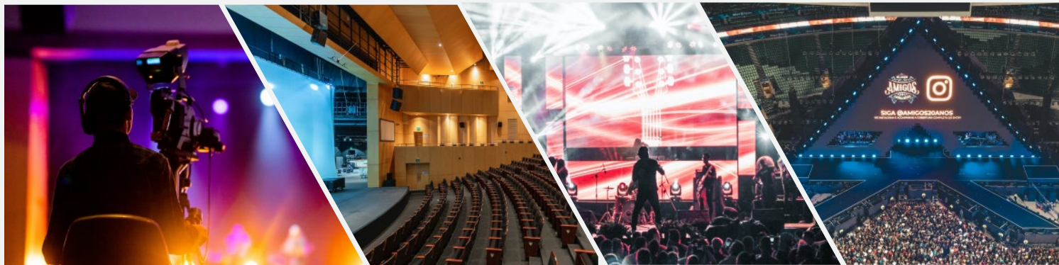
影视拍摄&XR虚拟拍摄